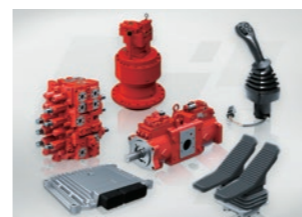
建設機械用油圧機器