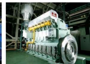
ハイブリッド推進システム船に 搭載される天然ガス専焼エンジン