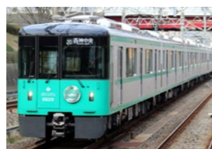
神戸市交通局 6000 形電車