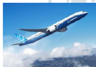
ボーイング787ドリームライナー