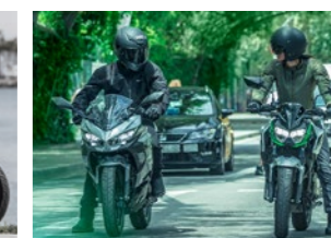
Ninja e-1 and Z e-1