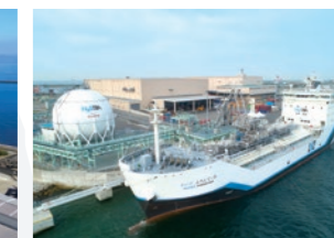
液化水素荷役実証ターミナルと 液化水素運搬船「すいそ ふろんていあ」