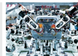
自動車ボディ組立ラインの スポット溶接ロボット [BX シリーズ]