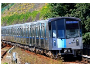
横浜市交通局 4000 形電車