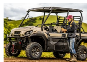
MULE PRO-FXT 1000