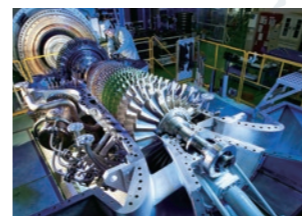
海外向けに初出荷した 30MW 級ガスタービン