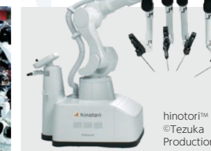
手術支援ロボットシステム [hinotori™ サージカルロボットシステム]