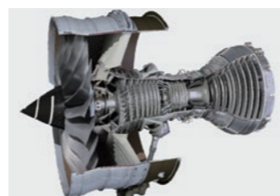
Trent XWB-97