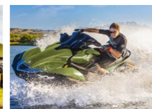
JET SKI® Ultra 310LX