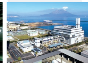
鹿児島市南部清掃工場向け ごみ焼却施設・バイオガス施設