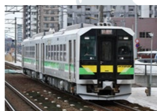
北海道旅客鉄道株式会社 H100 形気動車