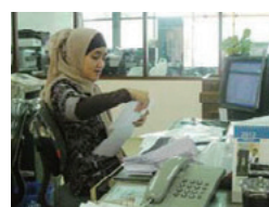
スカーフを着用した女性従業員