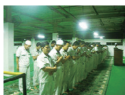
工場内の礼拝所 (ムショラ)

このように KMI では当地の宗教や文化、習慣に配慮し、従業員の人権を尊重した事業の運営を図っています。