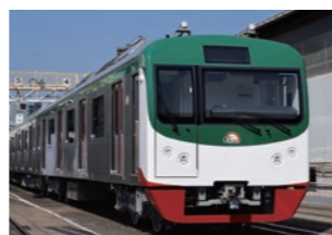
バングラデシュ ダッカ都市交通会社 ダッカMRT6号線電車