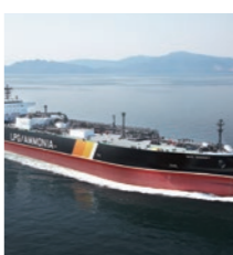
86,700m³型 LPG/アンモニア運搬船