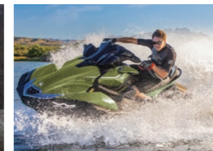
JET SKI® Ultra 310LX