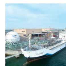
液化水素荷役実証ターミナルと 液化水素運搬船 [すいそ ふろんていあ]