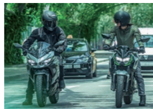
Ninja e-1 and Z e-1