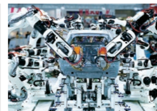
自動車ボディ組立ラインの スポット溶接ロボット[BXシリーズ]