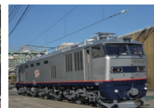
日本貨物鉄道株式会社 EF510形式 300番代電気機関車