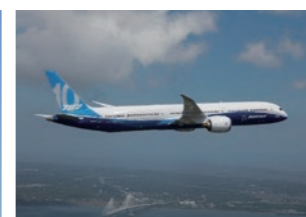
ボーイング787ドリームライナー