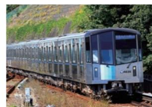
横浜市交通局4000形電車