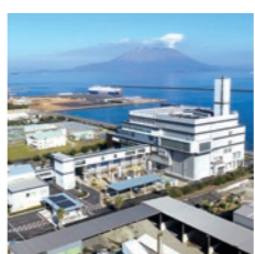
鹿児島市南部清掃工場向け ごみ焼却施設・ バイオガス施設