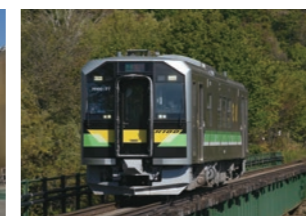
北海道旅客鉄道株式会社H100形気動車