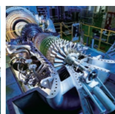
海外向けに初出荷した 30MW級ガスタービン