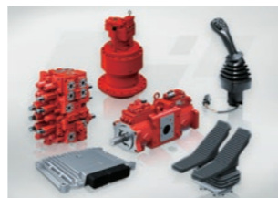
建設機械用油圧機器