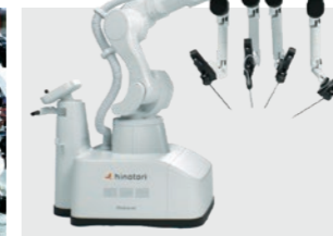
手術支援ロボット [hinotori™ サージカルロボットシステム]