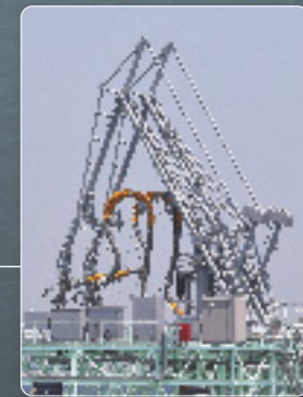
世界初の液化水素 ローディングシステム