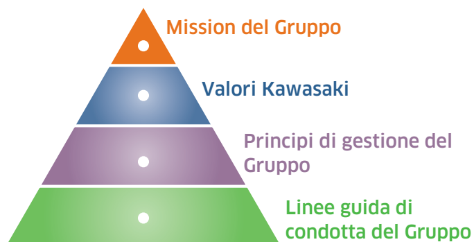
Struttura della Dichiarazione della Mission

Il Gruppo Kawasaki Heavy Industries intende creare nuovo valore per la realizzazione di una società futura prospera e bella, in armonia con l'ambiente globale, attraverso capacità tecnologiche avanzate e complete in un'ampia gamma di settori.