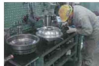
リビルドで再生中のトランスミッション

部品については、ホイールローダを解体処分する前に、トランスミッション、トルクコンバータ、足回りなど、再生が可能な部品を回収し、分解、洗浄、消耗品交換を行い、再度組み立てて(リビルド)、正規品と同じ性能を持つサービスパーツとしてメンテナンス用などに使用しています。