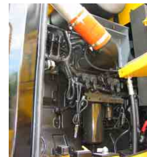
ターボチャージャー・インタークーラー搭載エンジン

吸気圧力を高くしてエンジンの効率を向上するターボチャージャーを搭載するとともに、圧力が高くなり高温になった吸気温度を下げるインタークーラーを設置することで、エンジンの効率向上と排出ガス中のNOx・ばいじんの低減の両方を同時に実現しています。