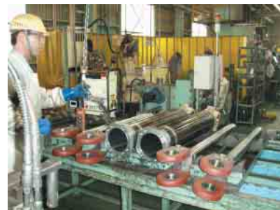
ニアネットシェイブによってつくられたホイストシリンダ

ホイールローダの本体には強度の必要な部品が多く、8~90mmの厚い鋼板が使用されます。鋼板を切断し必要な形状の部品をつくる時は、できるだけ同じ厚さの鋼板を利用することが可能な設計、無駄な切り残しを少なくする板取りなどを考慮して、鋼板の歩留まり向上を図り省資源を実現し、廃棄物の削減にもつなげています。