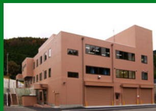
納入先:滋賀県大津市

容器包装リサイクル法が目指す循環型社会の仕組みづくりに貢献。プラスチック容器を、約1m角のサイコロ状に圧縮し梱包するシステム。圧縮梱包されたプラスチック容器は、新たなプラスチック製品やエネルギー源として有効に利用される。