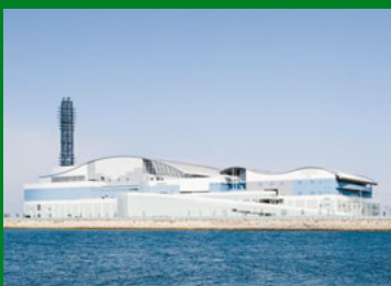
納入先:岸和田市貝塚市清掃施設組合

次世代型ストーカ式焼却炉のコア技術を取り入れた最新鋭のごみ焼却設備では、高効率の発電と排ガスの排出量削減・クリーン化を実現。プラズマ式灰溶融設備および資源化ごみリサイクル設備を備え、ごみの再資源化を推進。