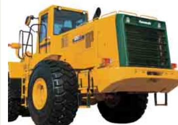
複合材の利用を廃止したリアグリル

ホイールローダのリサイクルを推進するためには、リサイクルしやすい機械であることが重要です。そのために、解体しやすい構造であること、材料が識別可能であることが必要です。たとえば、リヤグリルにおいて金属を埋め込んだFRP部品を廃止、樹脂製形部品に材質を表示するなど、さまざまな取り組み