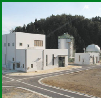
納入先:石川県珠洲市

下水汚泥やし尿などの有機性廃棄物と、水産加工の過程で発生する生ごみなどの事業系廃棄物を「集約混合処理」。メタン発酵処理により発生させたメタンガスを施設の暖房や汚泥乾燥のための燃料として利用。乾燥汚泥も有機肥料として地域に還元。これまでの「個別処理」に比べ、ライフサイクルコストを大幅に低減。