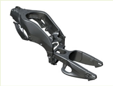
軽量化したアルミフレーム

また、リデュース(軽量化)に関しては、設計上の配慮として、大・中型機種へのアルミフレームの適用拡大を継続的に実施し、軽量化を図っています。