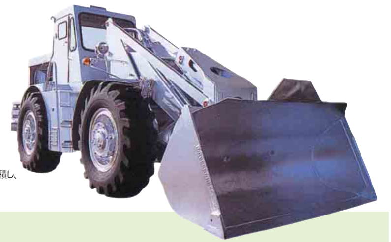
写真は昭和37年製造のホイールローダ初号機です

建設機械ビジネスセンターは、世界の人々の暮らしを豊かにし、快適な空間づくりに貢献することを理念として、国土のインフラ整備をはじめ、工事現場や工場などで安全かつ効率的に運搬・荷役作業を行うための建設機械を生産しています。ここでは、主力製品であるホイールローダのライフサイクルを通じた環境負荷低減活動を紹介いたします。