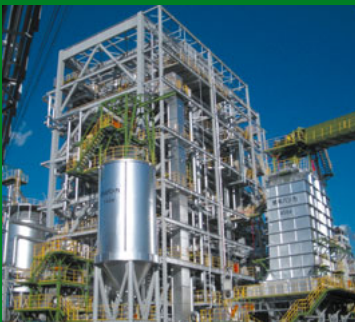
納入先: 東海パルプ(株)

木質燃料チップ、紙・プラスチック固形化燃料(RPF)など、生物資源や廃棄物を燃料として使用し発電する設備。当社独自の二重仕切壁構造を持つ内部循環流動床ボイラは、腐食の抑制とともに、性状や発熱量の異なる多種多様な燃料の混合燃焼が可能。化石燃料の低減により、地球温暖化防止に貢献。