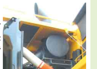
共鳴型消音マフラー

排気音に対しては、騒音として問題になる特定の周波数の吸音に有効な共鳴型消音マフラーを採用しています。