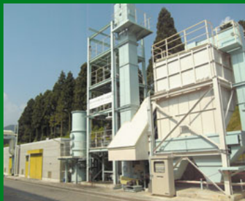
納入先: 積水ハウス(株)

当社独自の技術による発電・熱供給設備で、固定床ガス化炉とガスエンジン発電機で構成される。この設備では、木造工業化住宅の原材料製造過程で発生する製材くずを燃料として、発電とともに、排熱を乾燥用の熱風や事務所の暖房用として活用。資源の有効活用とCO 2 の削減を実現。