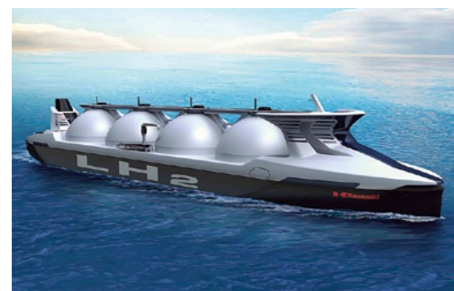
川崎重工が実用化を目指しているタンカー規模の液化水素運搬船(貨物槽容積4万m 3 ×4基)

「世界のエネルギー消費の拡大が予想される中、経済合理性と環境配慮を両立した一次エネルギーの需要割合を追究していくことが重要。エネルギー総合工学研究所は、製造段階でCO 2 排出のないCO 2 フリー水素が25～45円/