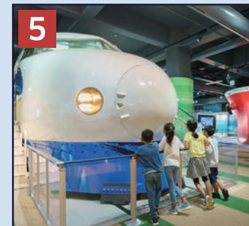
5 陸のゾーン 0系新幹線の実物を展示。客室や運転室にも入ることができます。