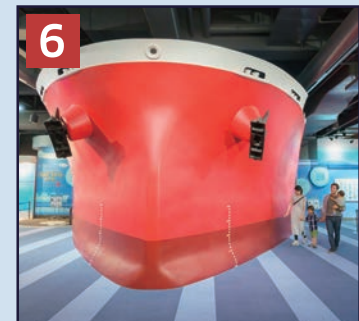
6 海のゾーン 船のかたちをした、ものづくりシアターでは船舶の進水式や新幹線・航空機ができるまでを映像でご紹介します。