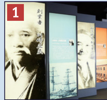
1 創業者紹介 創業者・川崎正蔵、初代社長・松方幸次郎についてご紹介します。