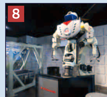
8 パフォーマンスロボット 工場で働く産業用ロボットたちが、動きながらその特徴をご紹介します。