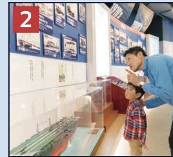
2 ヒストリーコーナー 1世紀以上にわたる川崎重工グループの歴史をご紹介します。