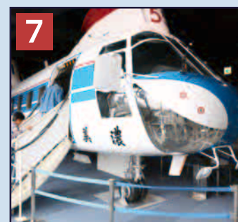
7 空のゾーン 大型の川崎パートルKV-107II型ヘリコプターの実物を展示。操縦室、客室内部をご覧ください。