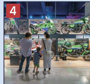
4 モーターサイクルギャラリー Kawasakiモーターサイクルの歴代マシン、レース車など、数多くの実車を展示しています。