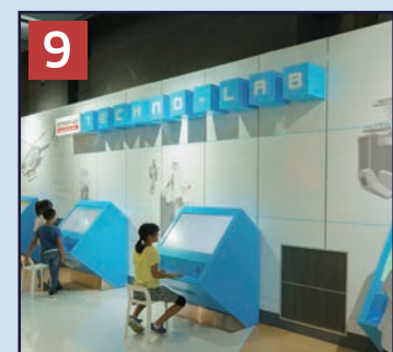
9 カワサキワールド TECHNO-LAB 当社製品の技術をイラストや動画を用いて個性豊かなキャラクターたちがご紹介します。