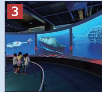
3 カワサキワールドシアター 約14mのワイドスクリーンに多彩な製品を、迫力ある映像でご紹介します。