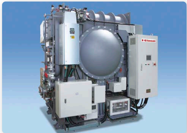
水冷媒ターボ冷凍機