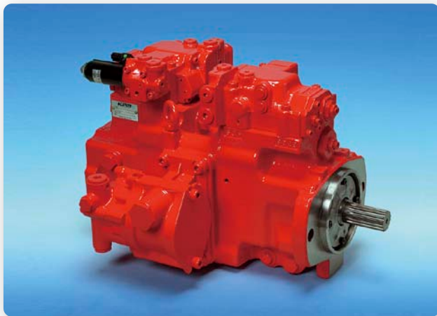
ショベル用油圧ポンプ (K7V)