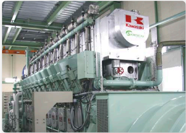
グリーンガスエンジン