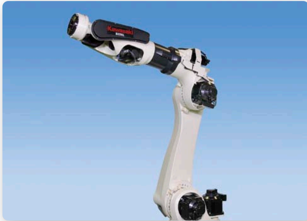
スポット溶接ロボット (BX200L SE22)