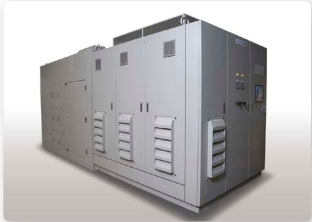
MAGターボ（曝気用単段ターボブロワ）