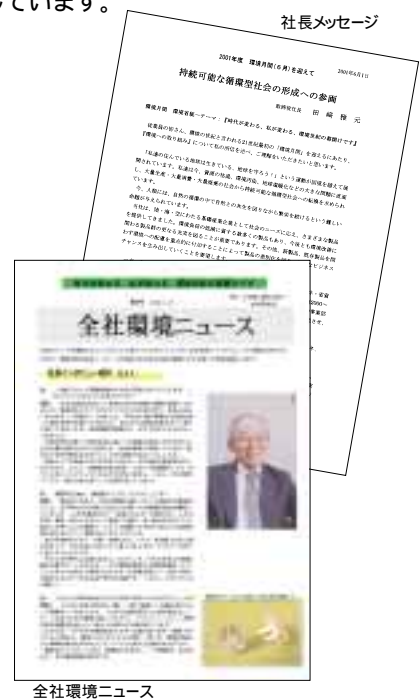
全社環境ニュース