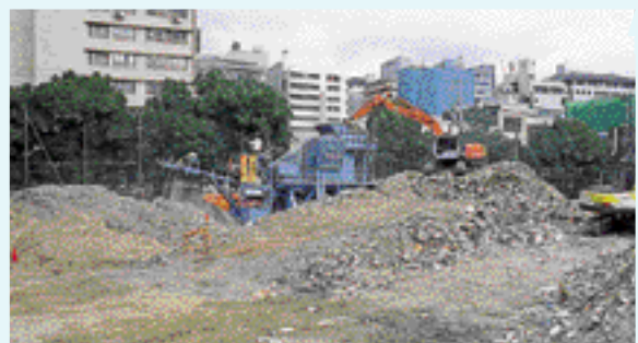
神戸市・磯上公園に設置されたジョークラッシャ

阪神・淡路大震災では、高速道路やビルが倒壊し、大量のがれきが発生しました。これを廃棄物として処分せずに、細かく破碎してコンクリートと鉄筋に分別し再利用するために、当社提供のジョークラッシャが活躍しました。万一の災害時には、今後も無償提供するべく、供給体制を整えています。