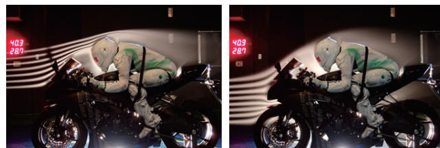
(a) ヘルメットへの流れ (b) ラジエータへの流れ

楕円ノズルによる複数の煙で、二輪車周りの流れを可視化している。トラバース装置により水平、垂直に取り付け