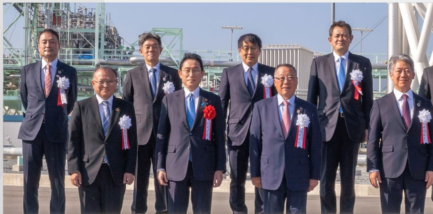
未利用褐炭由来水素大規模海上輸送サプライチェーン