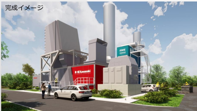
ドイツでの30MW級 水素ガスタービン発電所