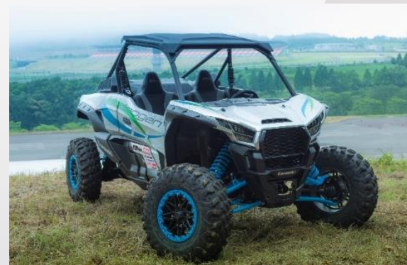
二輪車用水素燃焼エンジン搭載 研究用オフロード四輪車