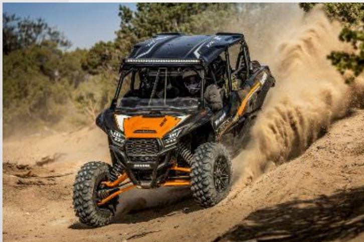
オフロード四輪車