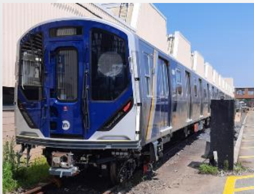
ニューヨーク市交通局向けR211地下鉄電車