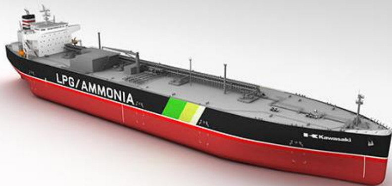
86,700m 3 LPG/アンモニア運搬船