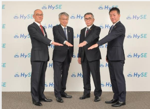
HySE設立時の 二輪車メーカー4社代表